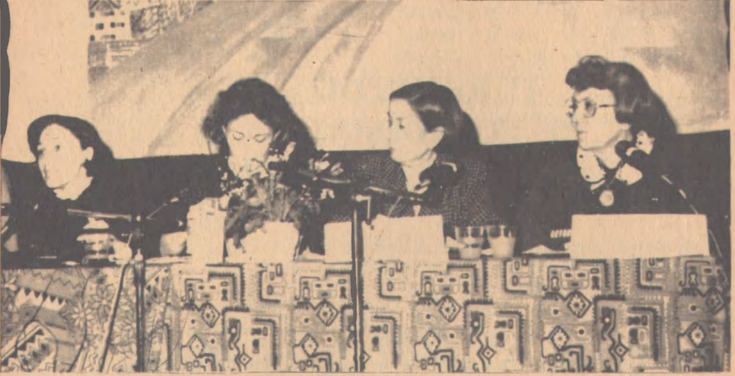
Berlin'de düzenlenen Kadın Hakları konulu panelden

lar üzerinde durdular ve soruları yanıtladılar.