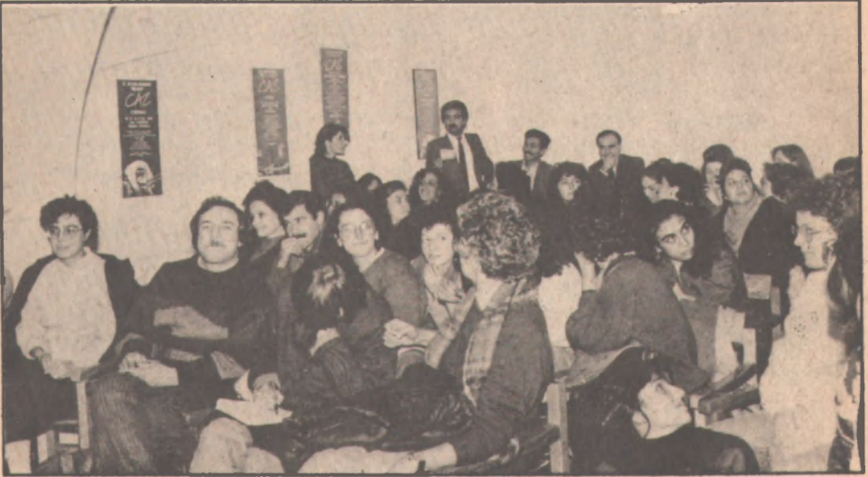
5 Ocak'ta Bilsak'taki söyleşiyile, kampanyamızın ikinci aşamasını, "işyerinde cinsel taciz" konusuyula başlattık.