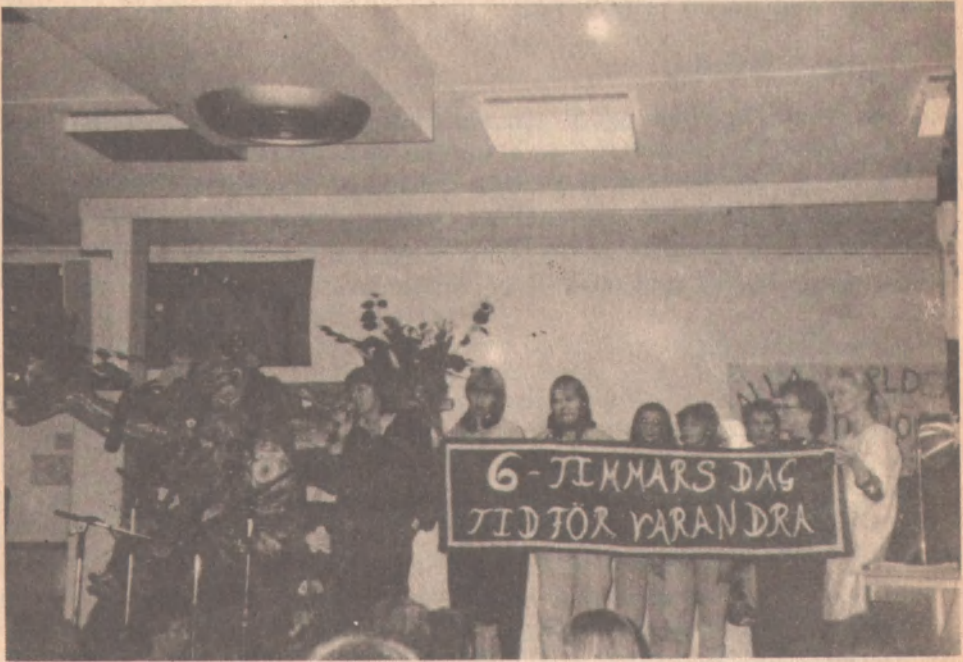
Kongreden bir görüntü.

de birbirlerinden izole olarak çalıştıklarından işverene karşı örgütlenmeleri daha da güçleştirilmiş oluyor.