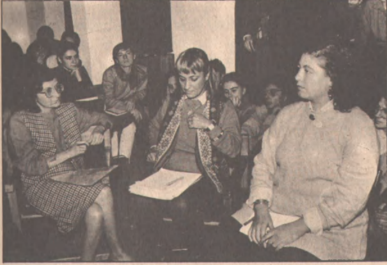
20-23 ve 24 Kasım tarihlerinde Bilsak'ta cinsel taciz üzerine söyleşiler yaptık. Özellikle kadınların yoğun ilgi gösterdiği bu ilk toplantılar esas olarak "sokakta cinsel taciz" konusunda odaklaştı.