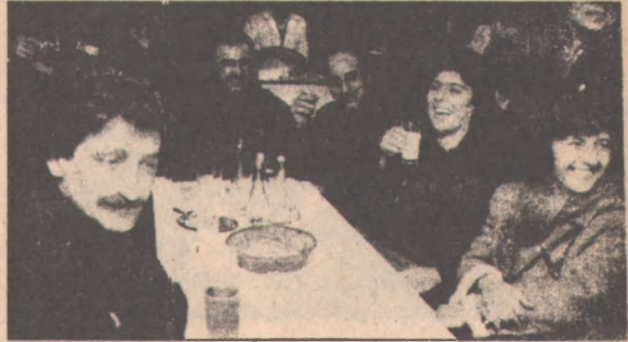
Yeni Çözüm, Aralık 89