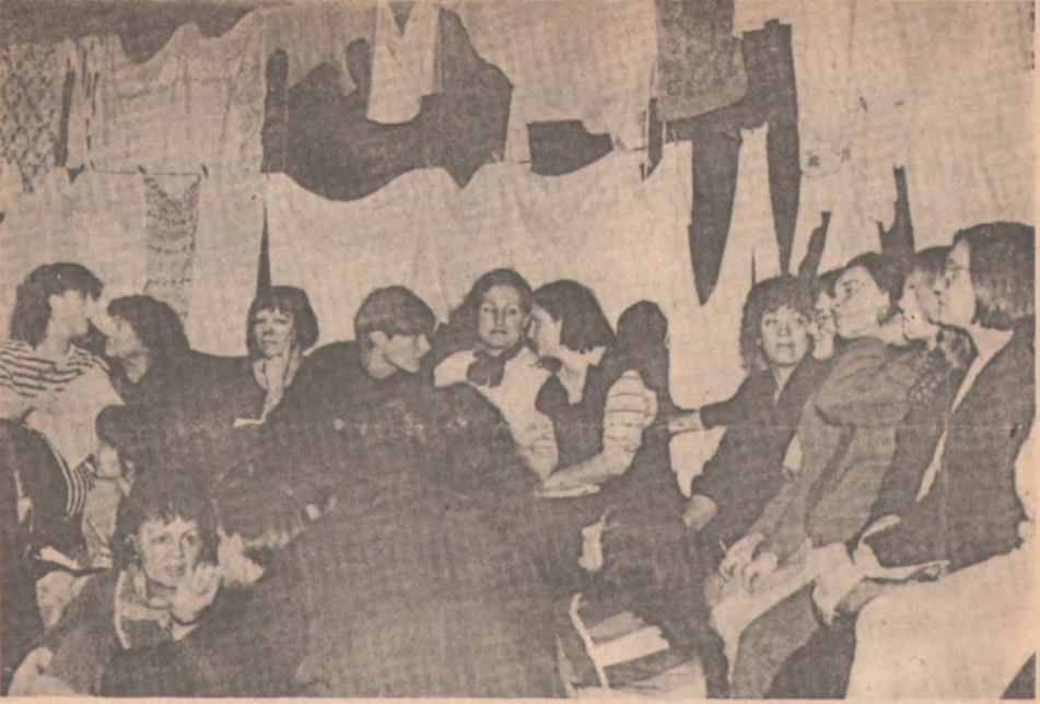
Doğu Berlin Halk Tiyatrosunda 1000 aşan kadının yaptığı toplantıdan bir görüntü (9 Aralık 1989 taz)

sloganla bürokratik hegemonyaya karşı isyanlarını yükselttiler. "Sokaklar halkın kürsüsü" diyerek alanlara kürsüler kurdular, muhalif gruplar konuşmalar yaptılar. Devlet Başkanı ve SED Sekreteri Honecker istifa etmek zorunda kaldı, yerine geçen Krenz de yine protestolarla düşürüldü. Gizli polisin evraklarına el kondu. Devlet imtiyazını kişisel çıkarları için kullanan parti ileri gelenleri teşhir edildi. SED Politbüro'su çekildi, yerine reformcu, yenilikçi olanlar seçildi. SED'nin adına bir de Demokratik Sosyalist ilave edildi.