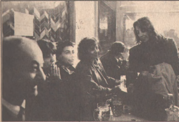
Bilsak çıkışında, bizi eve kapatmanın, toplumun pek çok alanının dışında bırakmanın da bir amacı olan cinsel tacizi protesto etmek üzere ve cinsel tacizin bizi istediğimiz yere gitmekten, istediğimiz gibi davranmaktan alıkoyamayacağını göstermek için, kadınların giremediği yerler olan birahane, meyhane ve kahvehane gibi yerleri kalabalık gruplar halinde ziyaret ettik.