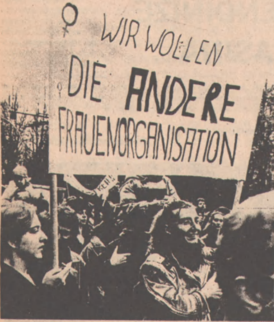
4 Kasım 1989 da Doğu Berlin'de kadın yürüyüşü Kadınlar cephesinden (17.12.1989-taz)

4-5 aydır önemli olaylar yaşanıyor Doğu Almanya'da. Ağustos'ta binlerce Doğu Alman vatandaşının kitleler halinde Batı Almanya'ya kaçıışı bir başlangıç oldu. "Burada kalıyoruz" diyenler, kaçmak yerine değiştirmeye kararlı olduklarını sokak-