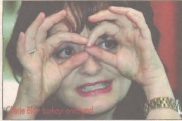
Cherie Blair burkayı ortırmadı!

(1) Laura Bush'un Ulusa seslenişi, 17 Kasım, 2001.