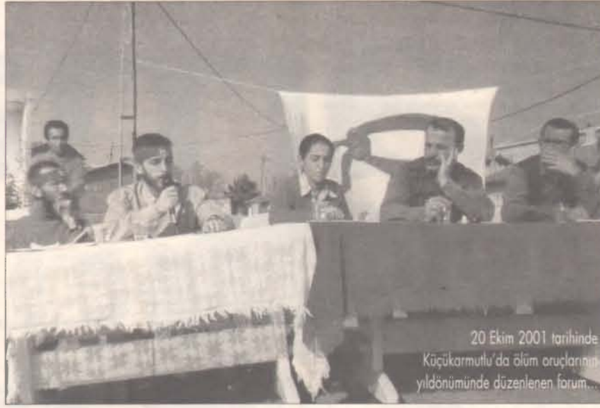
20 Ekim 2001 tarihinde Küçükarmutlu'da ölüm oruçlarının yıldönümünde düzenlenen forum.

tersi sonuçlar doğurabileceğini düşünüyorum belki başka araçlarla. En önemlisi cezaevi olmayan bir toplum için araçlar yaratılabileceğini de düşünüyorum. Bir de savaş nedeniyle ölüm orucunun gündem dışında kalacağı söyleniyor. Ama cezaevi sorunu Türkiye'nin kronik sorunu. Savaş bitebilir, çok uzun da sürebilir, cezaevi sorunu şimdi kapanabilir ama çözüm bulunmadığı sürece devam edecektir. Savaş tabiri kullanmak çok uygun gelmiyor bana. Emperyalist bloktan bir saldırı olarak tanımlanması daha doğru. Ama burada da şunu görebiliyoruz dünyada hegemonya kurmaya çalışan ya da ABD etrafında bloklaşmış emperyal yapılar var ama bunun karşısında dünyada halklar da var. Ve bu yeni mücadele biçimlerini yaratıyor. Oluşan yeni yapının içinde karşı bir örgütlenme de bu yapının içinden çıkıyor. Bu sürecin ölüm oruçlarına etkisi açısından söylüyorum, kısa vadede bir sessizlik yaratsa bile uzun vadede yeni bakış açısı ve mücadele araçlarının da başlayacağı bir dönem olacağını düşünüyorum.