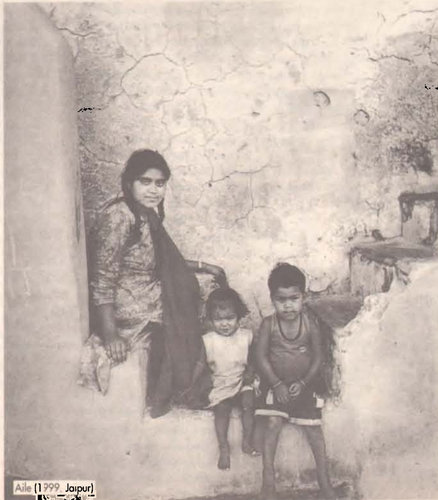
Aile (1999, Jaipur)

Evet, kardeşim. İkimizin de hayat bakışımız benzer. Birbirimize yakındır. Ona çok güvenirim. Birbirimiz seviniriz. Onu konuşurken leblebiyi arlarız.