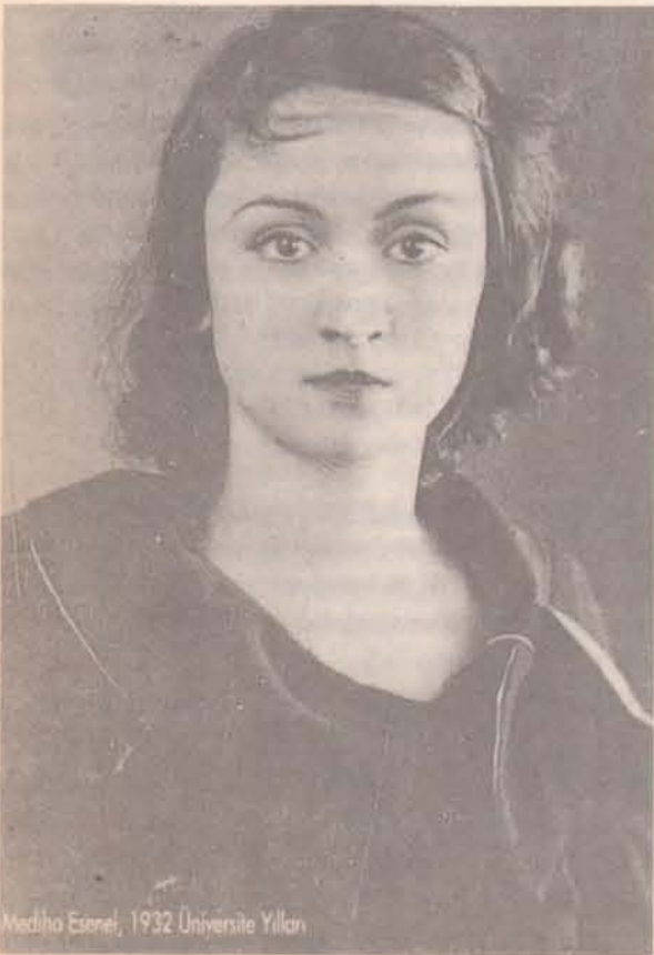
Mediha Esenel, 1932 Üniversite Yılları

1955 yılında Denizcilik Bankası’nda İngilizce çevirmen olarak çalışmaya başlar. Oldukça ağır bir işti. Hem evin sorumluluğu hem işin ağırlığı yıpratıcıdır, sigara içmeye de o dönemde başlar. Orada da haksızlıklar peşini bırakmaz. Beş yıl kadar çalışır. Lakin, 1960’lı yıllarda Robert Koleji’de felsefe ve sosyoloji dersi vermeye başlayınca, biraz olsun nefes alma fırsatını bulur. O dönemde kendi deyimiyle Boğaz’ı yüzerek geçecek kadar iyi bir yüzücüdür. Okulda bulunduğu süre içinde, yaz tatillerinde öğrencileriyle birlikte köylere giderler. Uzun bir aradan sonra 1960-70’li yıllarda köyleri tekrar gözleme fırsatını bulur. Yaşantının 1940’lı yıllardan pek de farklı olmadığını görür. Köye gidişlerinde,