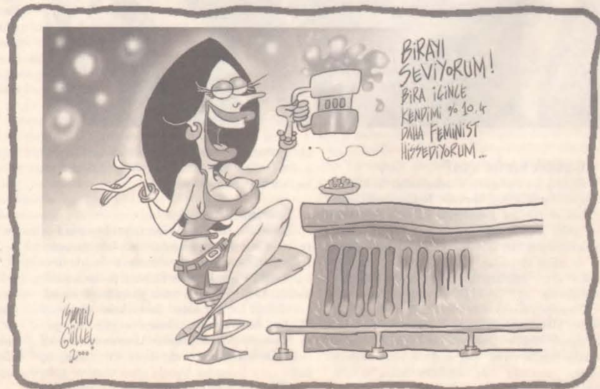
Kadınların % 10,4'ü bira içiyor

Hanede en çok pişirilen yemek türü ile kadının tüketim kalıpları arasında ne ilişki olabilir acaba? Bir bir yandan eve giren paraya, diğer yandan da koca ve çocukların yemek tercihlerine bağlıdır. Kocası ve ço-