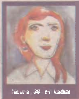
Nevra, 65, ev kadını