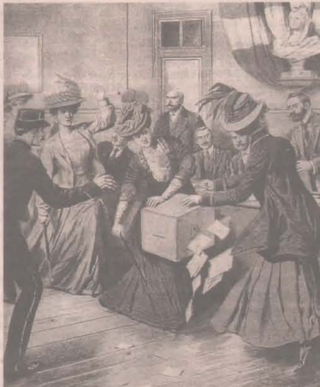
Süfrajyetler oy kullandıktan salona işgal edip bir oy sandığını ele geçiriyorlar.

1911 yılında Pelletier bir bunalıma girer. Büyük ölçüde, katıldığı gruplarda yaşadığı düş kırıklıklarından kaynaklanan bir bunalımdır bu. Pelletier sosyalist aidiyetiyle feminist aidiyetini birbirinden ayırmak zorunda kalmıştır. Parti içinde daha devrimci bulduğu Herve'ci grupta çalışmayı seçmekle partideki feminist mücadelesinden vazgeçmiş olur. Çünkü Herve'ci grup antifeministtir. Kadınların Dayanışması adlı feminist grubunda ise radikal politik çizgisi yüzünden birçok kadının desteğini yitirir. Dolayısıyla 1911'de tüm militan faaliyetine son verir. Kendisini parti içindeki kadın grubundan da uzak tutmaktadır. Orada burada kadınları ve proleterleri çekiştirir: Artık bu insanlarla hiçbir şey yapmayacağımı, hiçbirinin devrim yapacak cesarete sahip olmadığını söylemektedir. Savaş bütün bunların üzerine tuz biber eker. Artık kendini her yandan ihanete uğramış gibi hissetmektedir: En saygı duyduğu feministler cephedeki askerler için örgü örmekte, en saygı duyduğu sosyalistler savaş hükü-