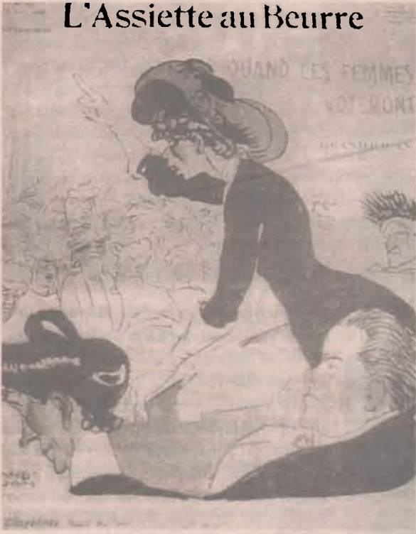
Ünlü hatip Madeleine Pelletier

nur; asıl sorun cinsler arası eşitsizliktir ona göre. Dolayısıyla da, heteroseksüel ilişkilerin kadınları aşağıladığı bir döneme özgü, konjonktürel bir karar olarak, ne erkeklerle ne kadınlarla sevişmeyi seçer. Nitekim otobiyografik romanının adı Bakire Kadın 'dir. Otuz, otuz beş yaşlarındayken bir ara lezbiyenliği bir ihtimal olarak düşündüğü, o dönemde yazdığı mektuplardan ortaya çıkmaktadır. Ancak aynı cinsten insanlar arasında cinsel ilişkileri doğaya aykırı olarak görmeye yatkındır. Ayrıca heteroseksüel birliklerde yaşanan iktidar ilişkilerinin lezbiyen ilişkilerde yeniden üretileceğinden kaygı duymaktadır. Ve yalnızlığı seçer.