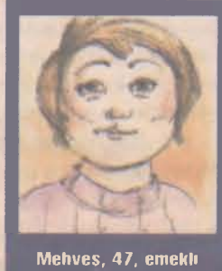
Mehves, 47, emekli

İlgi: Ben de partnerimi yönlendirmekten hoşlanırım. O uyurken uyandırmak hoşuma gider. O beni uyandırsa hoşlanmam ama. Bir de yersiz ve zamansız sevişmeleri seviyorum.