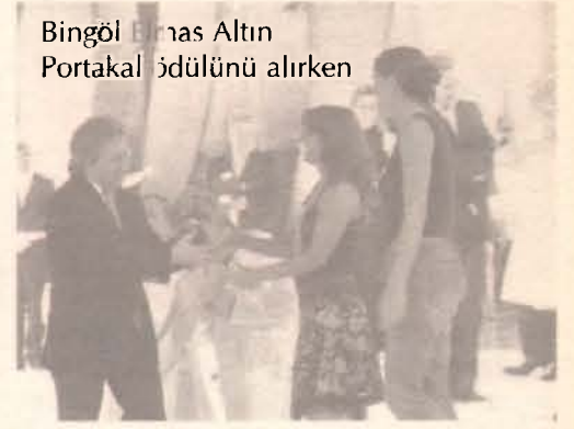
Bingöl Birnas Altın Portakal ödülünü alırken